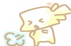
12:00 病棟看護師へ申し送り