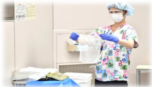
レントゲン確認、手術終了