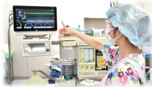
術中記録、モニター観察