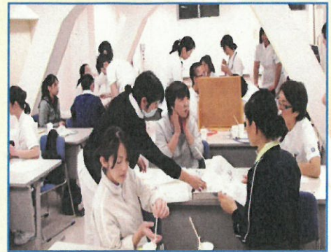
院内研修会の様子

今回の地域支援講座では、嚙下とポジショニングをテーマに開催します。 講義だけではなく、少人数グループでの実習を予定しています。グループ毎に、実習担当者(リハビリ科医師・言語聴覚士等)がつく都合上、参加人数を30名と限らせて頂きます。