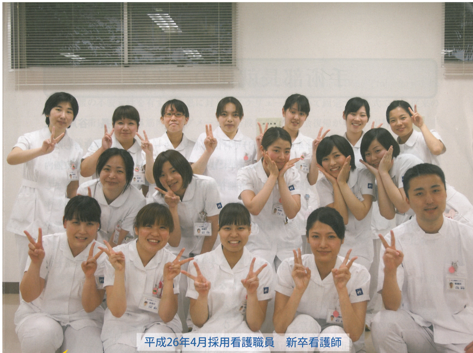
平成26年4月採用看護職員 新卒看護師