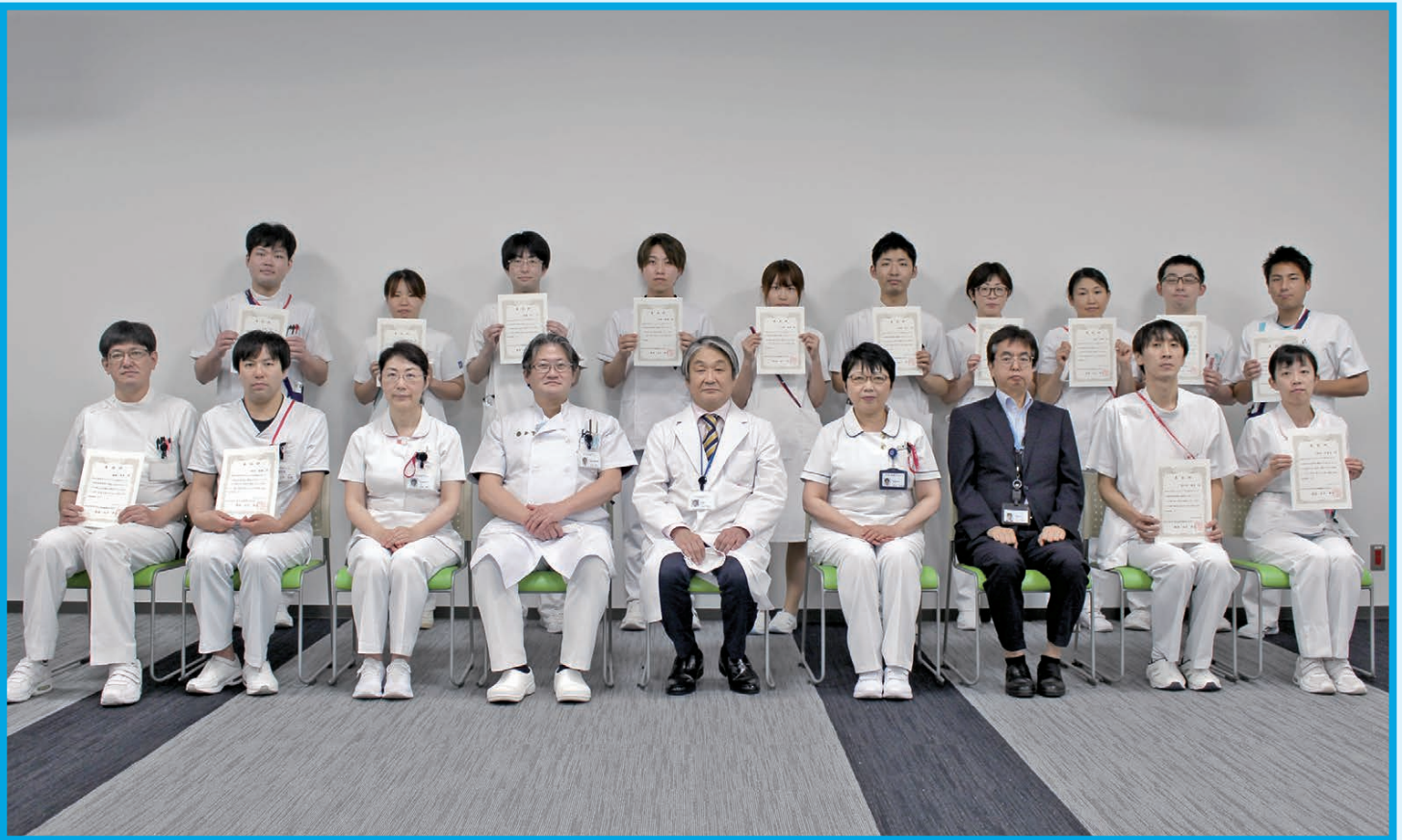
職員表彰式（コロナ対策病棟に志願して勤務した看護師が表彰されました）