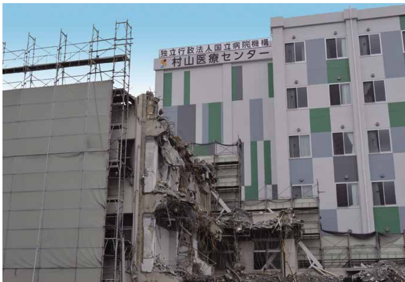
取り壊しの進む旧病棟

〒208-0011 東京都武蔵村山市学園 2-37-1 TEL 042-561-1221 FAX 042-564-2210 http://www.murayama-hosp.jp/